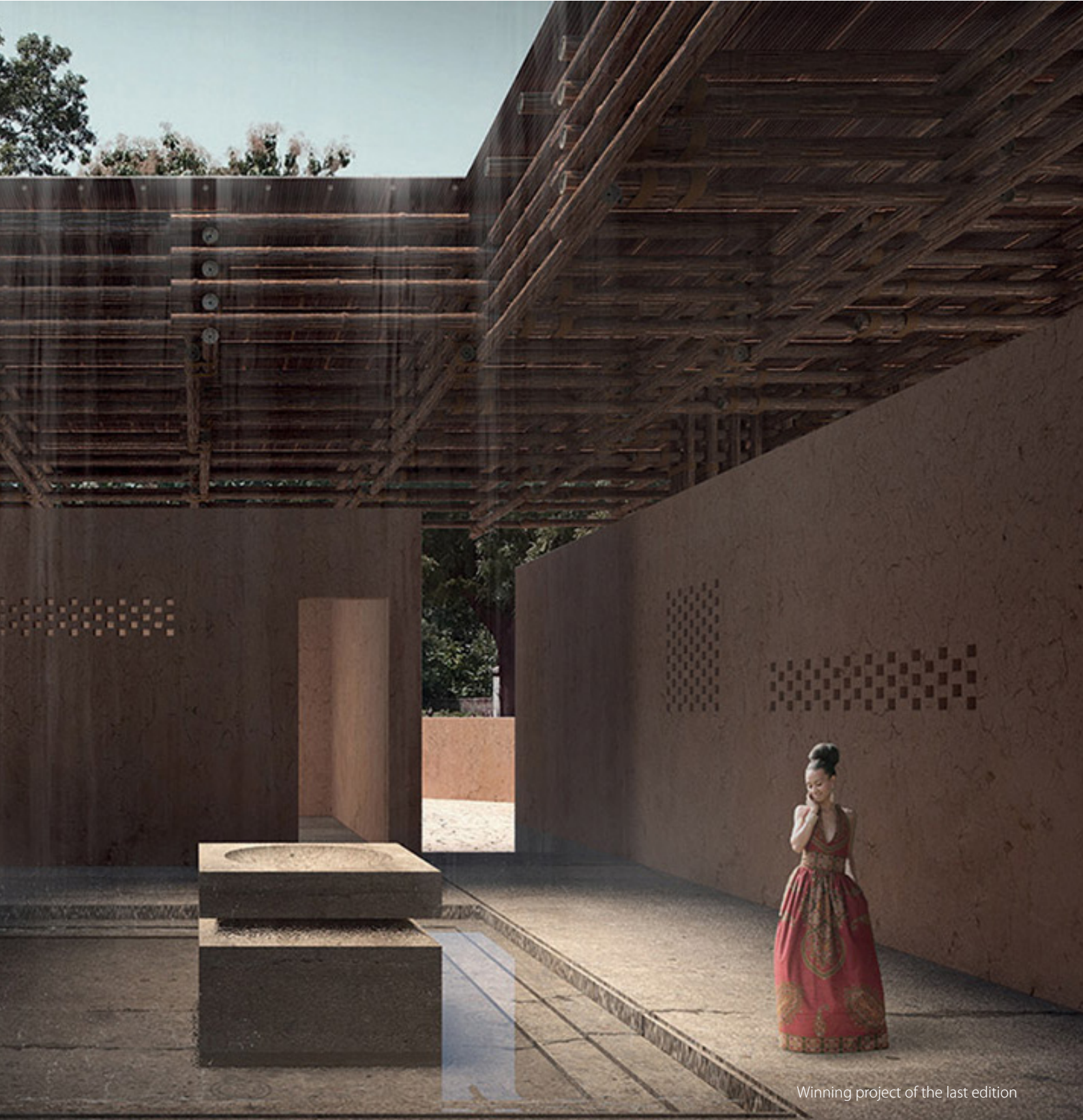
Winning project of the last edition