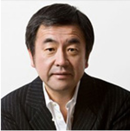
Kengo Kuma Kengo Kuma & Associates Tokyo, Paris, Beijing