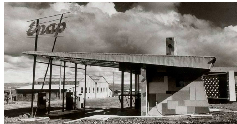
Figura 01: Fachada Norte del edificio.

Estado de protección: Declarado Monumento Histórico dentro del estado de Zona Típica del campamento Cerro Sombrero, el 20 de octubre del año 2014, por el decreto N°421.