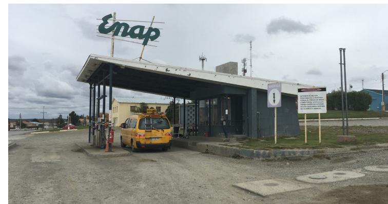
Figura 02: Vista desde la entrada al Surtidor.

Condición actual: Se encuentra en buen estado, presentando tan solo algunos deterioros naturales de pintura dados por la humedad del sitio.