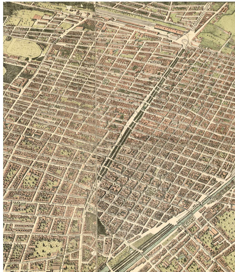
Fragmento del plano de Santiago, dibujado por H. G. Highley, 1904