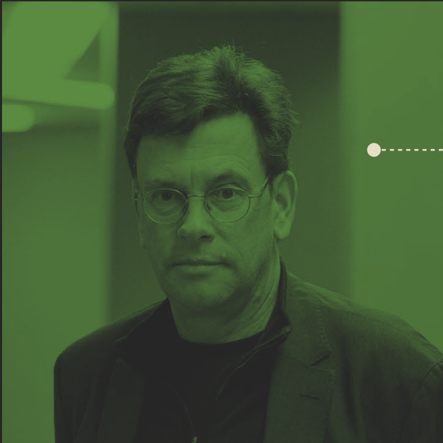
PHILIP URSPRUNG SUIZA | HISTORIADOR ARTE Y ARQUITECTURA