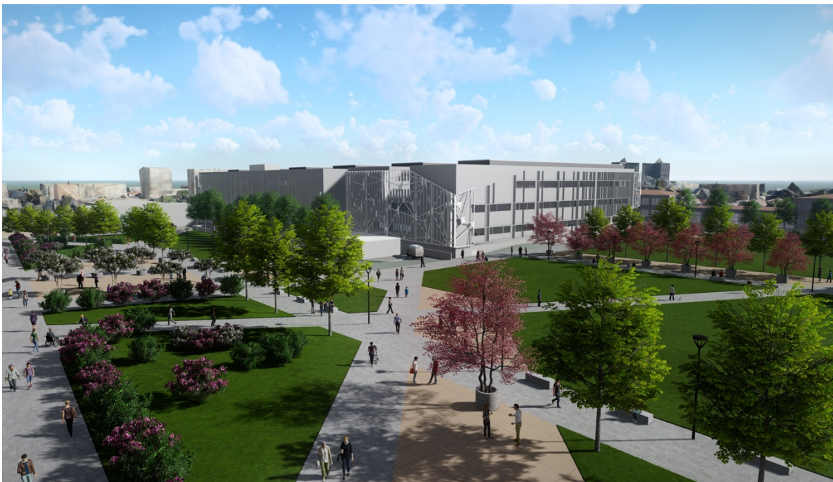
Figura 01. Imagen Objetivo Preliminares de la Plaza de Acceso al Hospital Instituto de Neurocirugía.

El diseño de este espacio - comprendido como plaza-jardín - se deberá relacionar, por un lado, con aspectos funcionales de accesos y circulaciones que relacionan al Hospital con su entorno urbano y, por otra parte, con funciones terapéuticas basadas en el concepto de "healing landscape", en el marco de los procesos que se llevan a cabo en el Instituto de Neurocirugía.