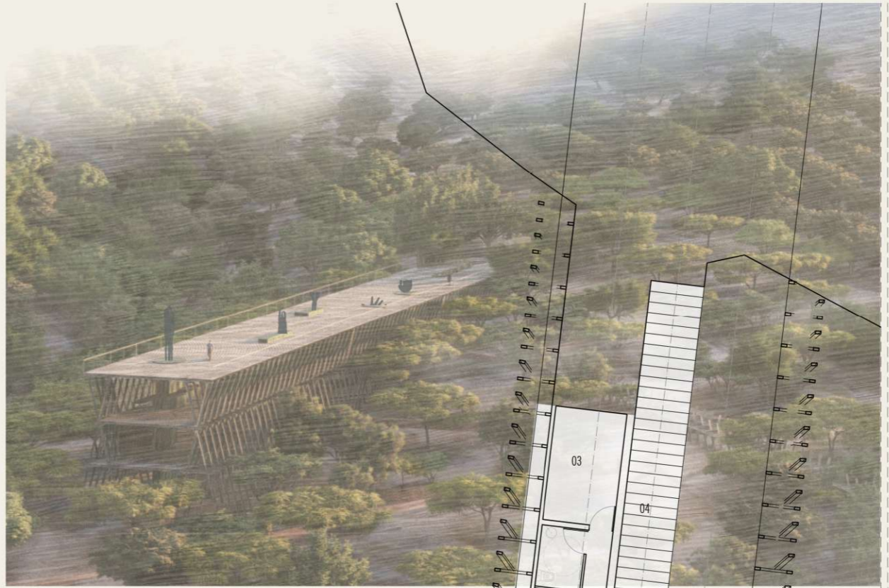
VISTA VUELO DE PAJARO HACIA EL ORIENTE