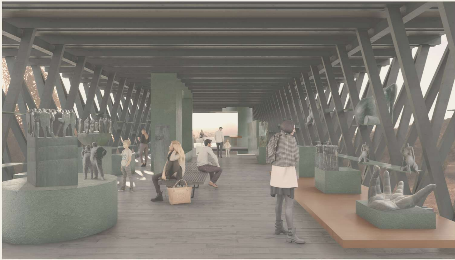
VISTA INTERIOR DEL MUSEO