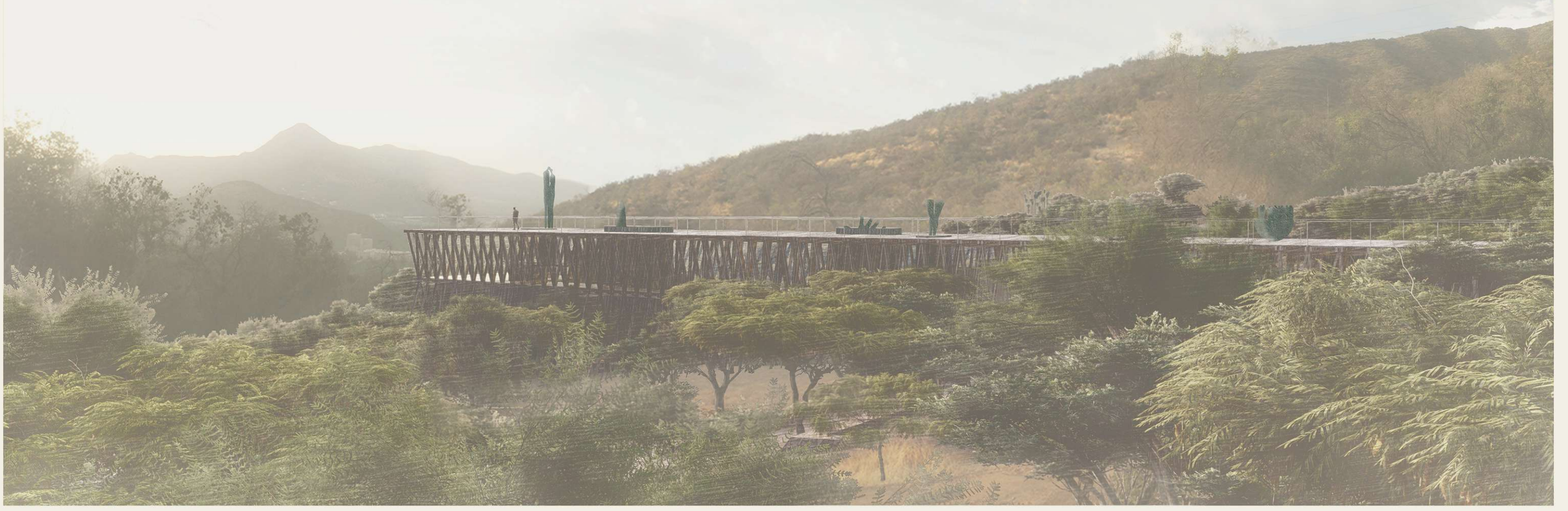
VISTA DESDE EL PARQUE HUMANO HACIA EL NORTE